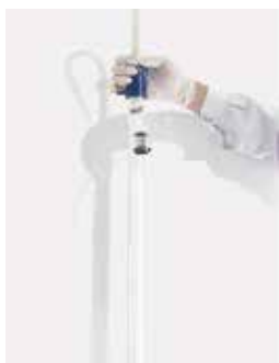
装柱展示: S XK 16/70 装填 Superdex 75 Prep Grade